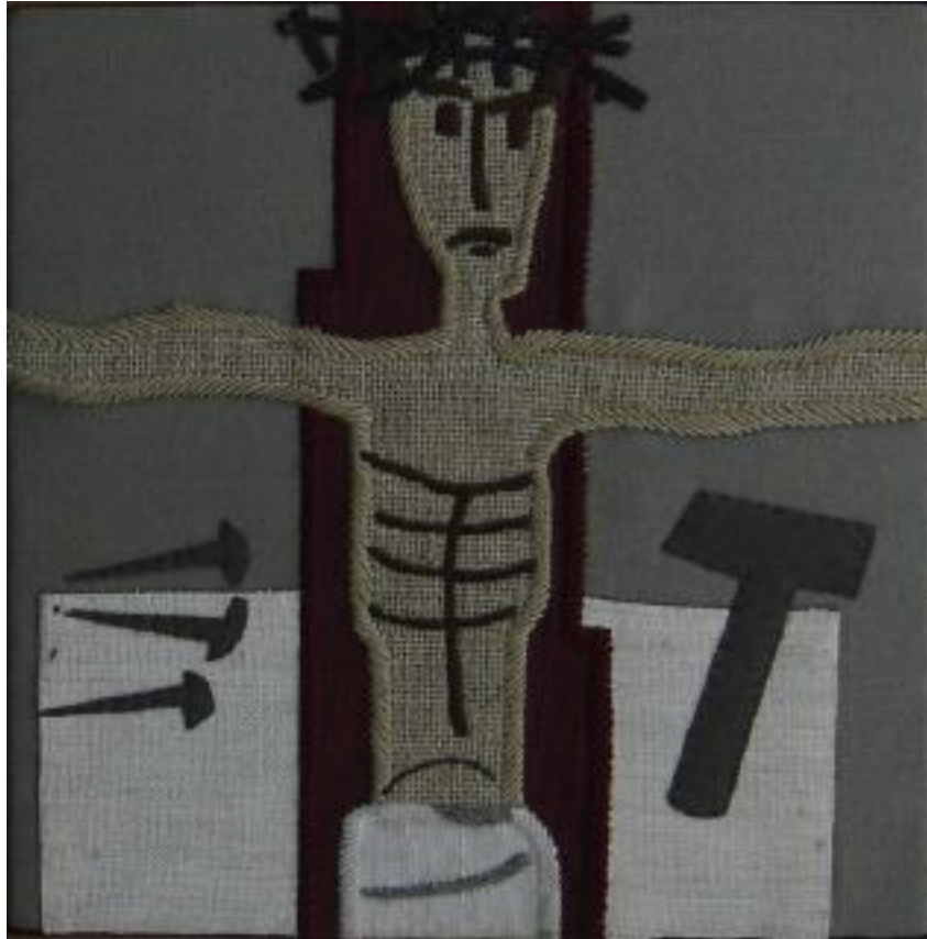
Jezus wordt aan het kruis genageld